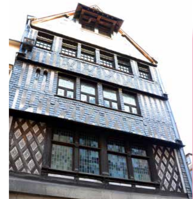
Maison natale de Pierre Corneille.

L'intégration de cette maison d'écrivain complète celle de la Maison des Champs de Pierre Corneille, située à Petit-Couronne, en 2016. La maison natale Pierre-Corneille s'affirme ainsi pleinement comme lieu de mémoire d'un écrivain mondialement célèbre, au cœur de Rouen et de sa Métropole.