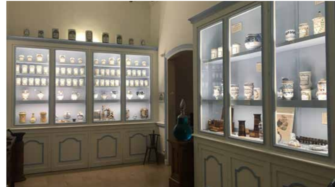
Apothicairerie, 2019.