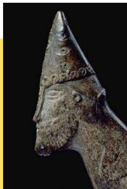
Les routes commerciales, les liens politiques et la colonisation permettent, durant l'ère viking, l'arrivée en Scandinavie d'idées et de croyances religieuses nouvelles.

Pour plus de renseignements sur les expositions présentées dans chacun des musées, rendez-vous sur le site → musees-rouen-normandie.fr