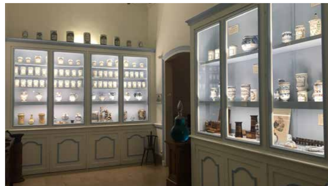
Apothicaire, 2019.

Le Pavillon est racheté, puis donné en 1906 à la Ville de Rouen et transformé en musée. Il renferme aujourd'hui quelques souvenirs intimes liés à l'écrivain.