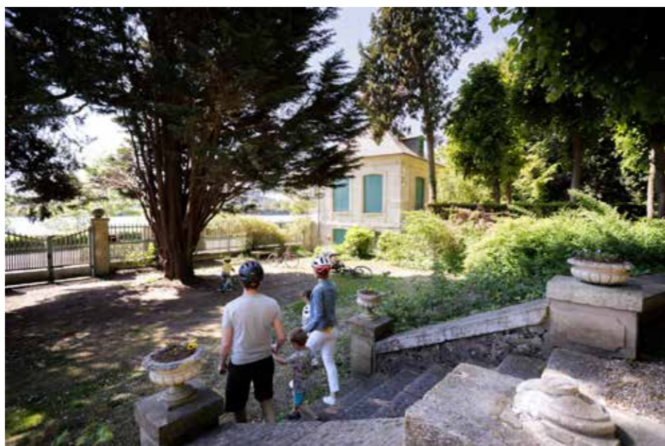
Le Pavillon Flaubert.

Le pôle littéraire vient compléter les différents pôles déjà présents au sein de la RMM : le pôle Beaux-Arts avec le musée des Beaux-Arts, le musée de la Céramique et le musée Le Secq des Tournelles, le pôle Sciences et histoire avec les musées Beauvoisine et, pour finir, le pôle Arts et industrie composé de la Fabrique des savoirs et du musée de la Corderie Vallois.