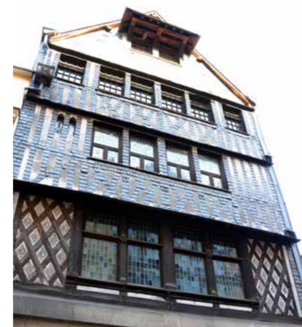
Maison natale de Pierre Corneille.

L'intégration de cette maison d'écrivain complète celle de la Maison des Champs de Pierre Corneille, située à Petit-Couronne, en 2016. La maison natale Pierre-Corneille s'affirme ainsi pleinement comme lieu de mémoire d'un écrivain mondialement célèbre, au cœur de Rouen et de sa Métropole.